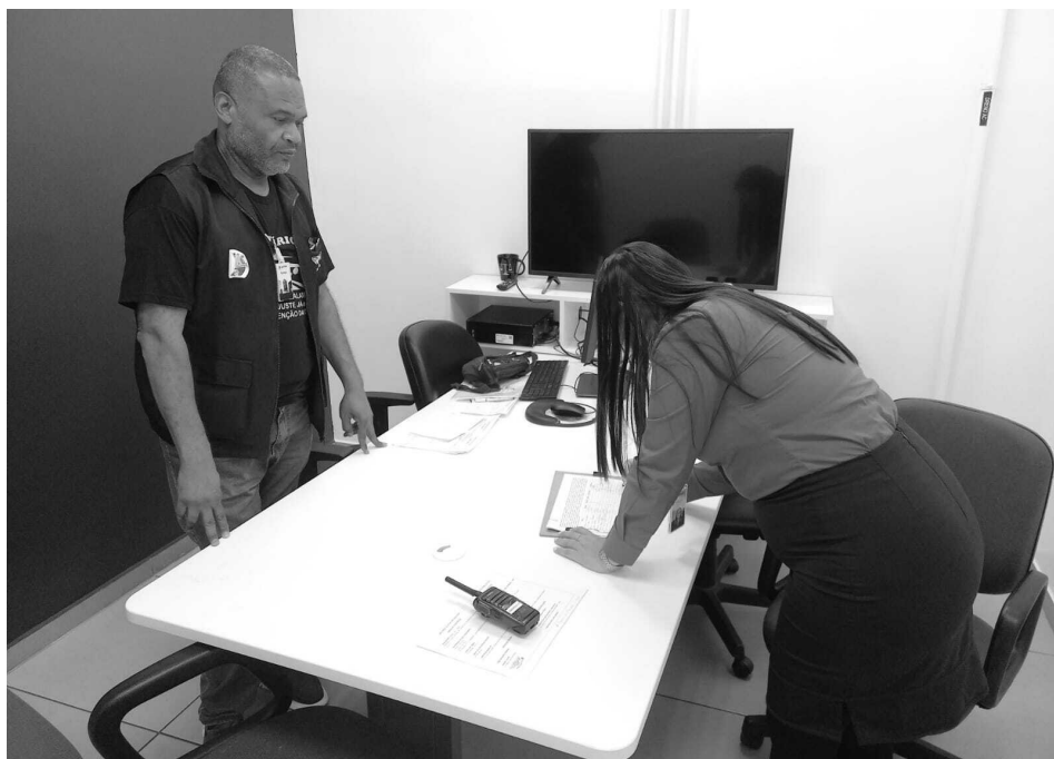
Ao total, 163 votantes participaram da assembleia.

Nesta segunda (20), das 7h às 18h, os aeroviários da LATAM puderam votar e decidiram, com 99% dos votos, por aprovar a proposta de Acordo Coletivo de Trabalho (ACT) negociada com representantes da empresa pelo Sindicato dos Aeroviários de Porto Alegre.