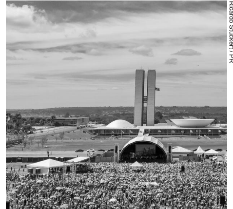
Ricardo Stuckert / PR

O Agosto Lilás, que alerta para o combate à violência contra a mulher, o Agosto Dourado, pelo aleitamento materno, e a Marcha das Margaridas são as lutas que marcaram o mês de agosto para as mulheres. Para informar a categoria sobre essas pautas, o Sindicato distribuiu um material informativo sobre as três causas nas empresas.