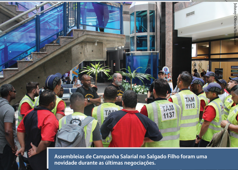
Assembleias de Campanha Salarial no Salgado Filho foram uma novidade durante as últimas negociações.