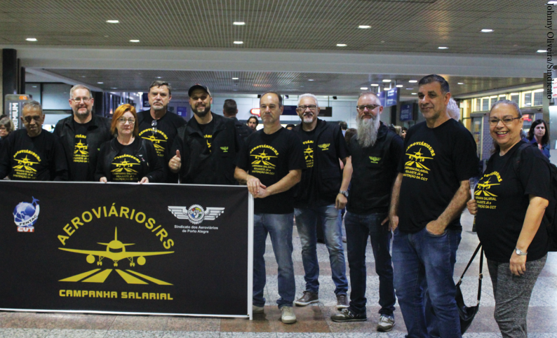
Diretoria de Porto Alegre lançou a Campanha Salarial 2018/2019 no Salgado Filho no mês de outubro.