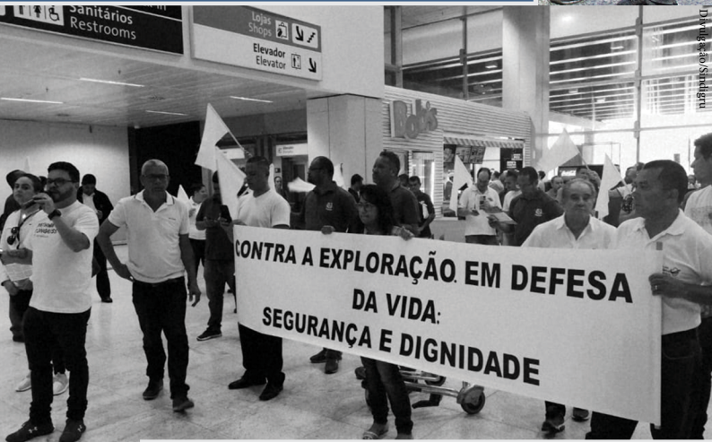
No final do ano passado, o Sindigru realizou ato contra agressões a aeroviários no aeroporto de Guarulhos.