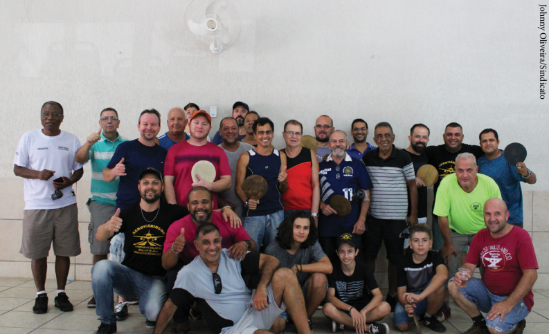
Disputas esportivas foram motivo de reunião e festa da categoria na sede sindical em Porto Alegre.