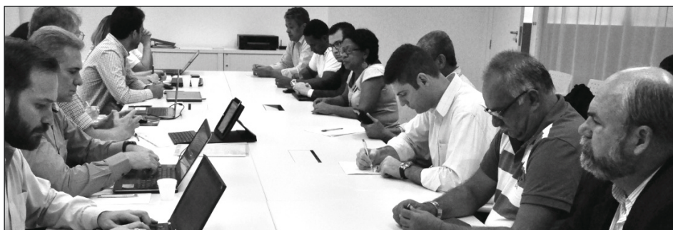
1ª rodada da Campanha Salarial, em 21/10

Os trabalhadores, no entanto, estão preparados para contestar esses números, amparados por estudo setorial do Dieese. Os dados serão apresentados na