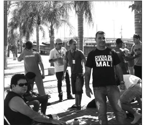
Sindicato apoiou protesto dos aeroviários do Teca